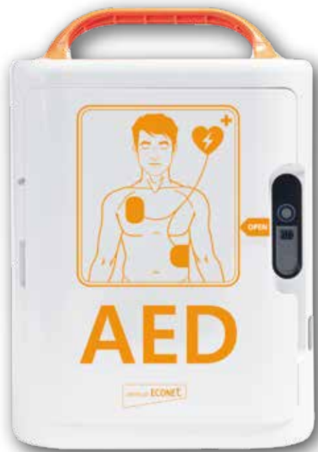
ECOPAD - Der kosteneffektivste AED. ECOPAD - The most cost-effective AED.